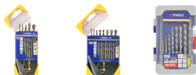
5 brocas para hormigón graduadas SLR Ø 4 a 10 mm 8 brocas para hormigón graduadas SLR Ø 3 a 10 mm 9 brocas para hormigón graduadas SLR Ø 3 a 12 mm